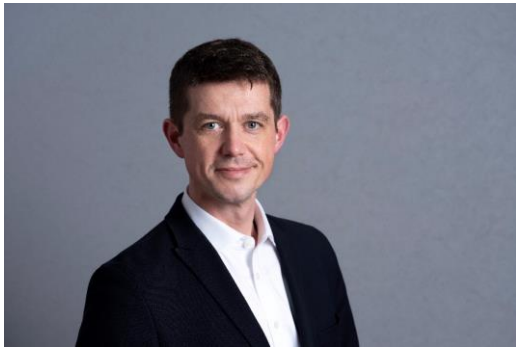
Dr. Christian Ude, Präsident.