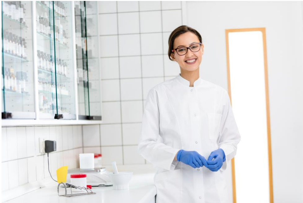
Das Zentrallabor stellt eine Praxishilfe zur Nahinfrarot-Spektroskopie bereit.