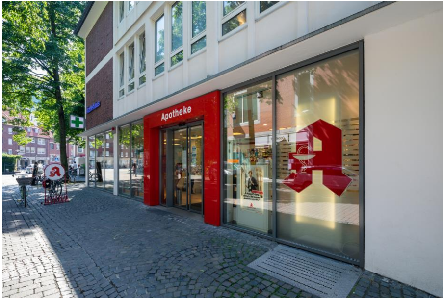
Urteil zum Arbeitspreis für Spezialrezepturen.